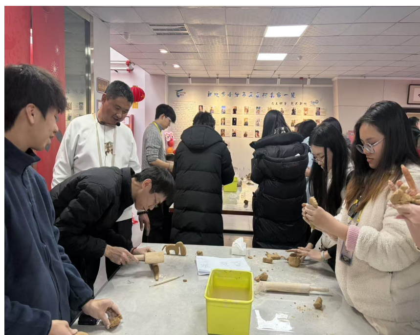
近日，在小分子美术馆，厦门大学的学子在学习制作泥塑。

马年的脚步悄然临近，美术馆内的手作体验区暖意融融，一场别开生面的手作生肖马活动在此开启。在非物质文化遗产代表性传承人及驻村艺术家的指导下，厦大学子们拿起工具，从勾勒轮廓、裁剪塑形到拼接装饰，一步步用心制作专属的生肖马手作。指尖翻飞间，一个个形态各异、憨态可掬的生肖马逐渐成型，或灵动活泼，或沉稳大气，既饱含着大家对马年龙马精神、策马扬鞭的美好期许，也让学子们在动手实践中体验传统手工艺的魅力。