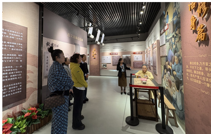
近日，木垒县委党校教职工赴闽开展交流学习活动。图为教职工在漳州谷文昌纪念馆参观学习。

本报讯 通讯员李钰、王睿报道：近日，在福建援疆漳州分指挥部的支持下，木垒县委党校组织教职工赴福建漳州开展为期7天的交流学习活动。此次活动以实地研学、座谈交流等形式，让教职工在学习中感悟红色精神、汲取办学经验。