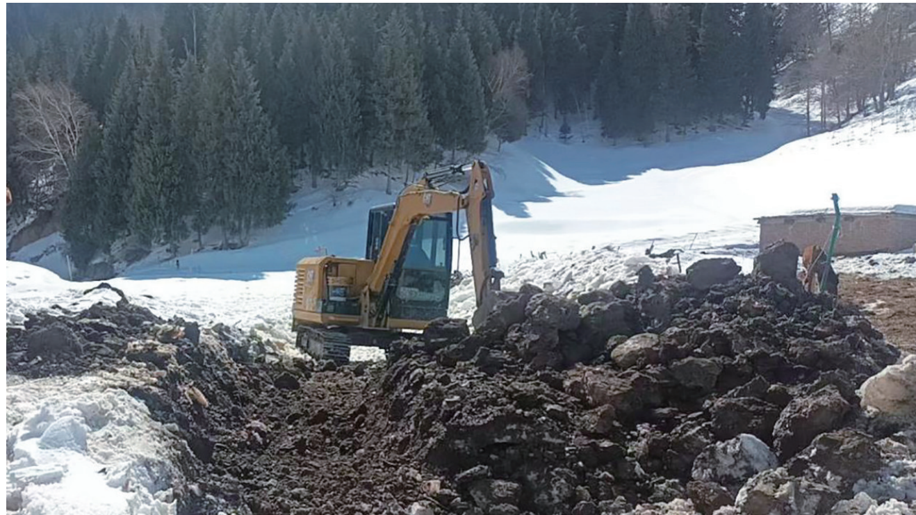
近日,木垒县大南沟乌孜别克族乡东沟村山区道路正在加固修缮。