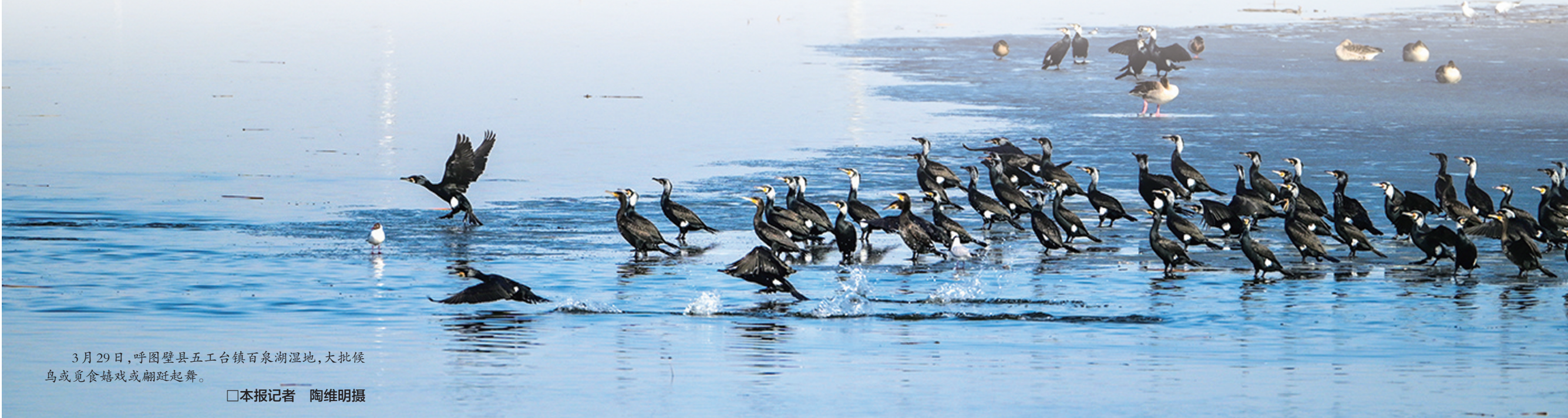
3月29日,呼图壁县五工台镇百泉湖湿地,大批候鸟或觅食嬉戏或翩跹起舞。