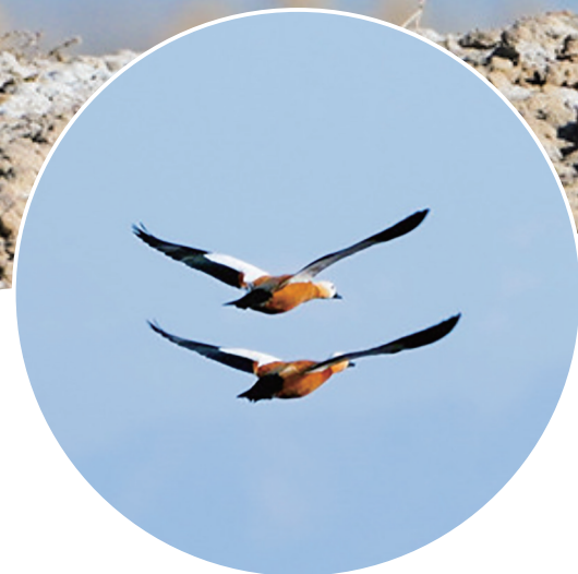
近日,吉木萨尔县红旗农场下兴湖水库,赤麻鸭振翅高飞。