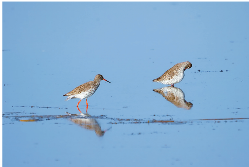
近日,吉木萨尔县红旗农场下兴湖水库,赤足鹬在水中悠闲踱步。

鸟儿翩跹迎春归 □本报记者 陶维明 暖阳倾泻,残冰化作粼粼波光,沉寂了一冬的水面重新有了呼吸。最先感知春意的,是那些如约而至的鸟儿。 它们成群结队,或振翅盘旋于碧空,或悠然漂浮于水面。赤麻鸭成双成对,棕红色的羽翼在阳光下闪着金属般的光泽,时而把头探入水中觅食,时而扑棱着翅膀溅起晶莹的水花。忽然,一只水鸟掠过水面,翅尖划破倒映着蓝天白云的镜面,涟漪一圈圈荡开去。成群结队的灰鹤也来到农田里觅食、嬉戏,鸣叫声不绝于耳,为初春的乡村增添了一道美丽的风景。 岸边,摄影爱好者早已架好设备,屏息等待那最动人的瞬间。咔嚓声中,飞翔的姿态、嬉戏的场景被一一定格。 冰雪消融是春天的序曲,水鸟翩跹是生态的注脚。在这片渐渐苏醒的土地上,人与自然正共同谱写着和谐的乐章。