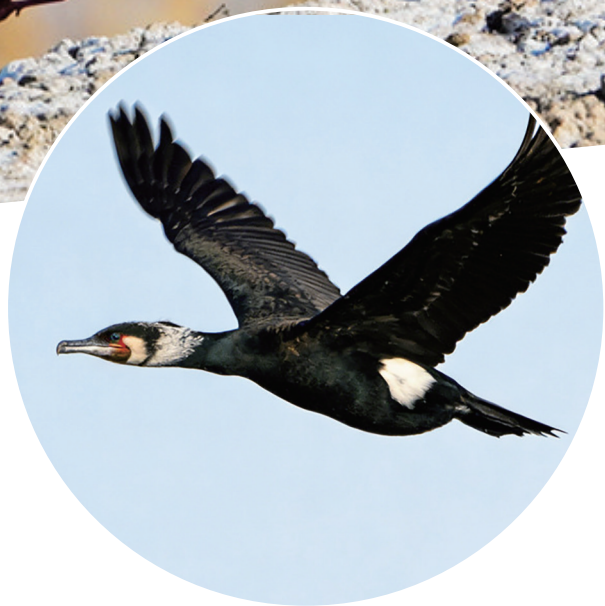
近日,吉木萨尔县红旗农场下兴湖水库,鸥鹭翱翔天空。