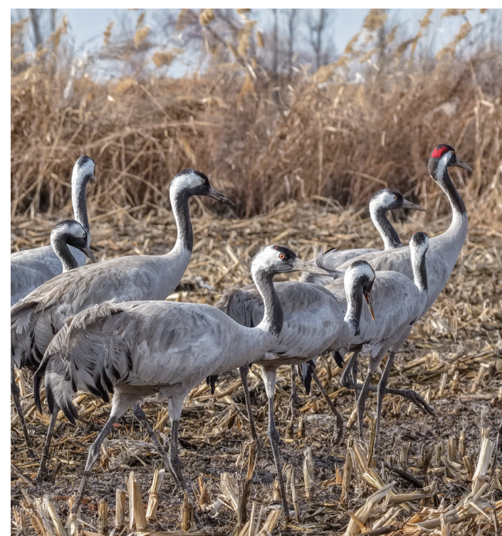
3月17日,呼图壁县园户村镇,灰鹤在农田里觅食。

鸟儿翩跹迎春归 □本报记者 陶维明 暖阳倾泻,残冰化作粼粼波光,沉寂了一冬的水面重新有了呼吸。最先感知春意的,是那些如约而至的鸟儿。 它们成群结队,或振翅盘旋于碧空,或悠然漂浮于水面。赤麻鸭成双成对,棕红色的羽翼在阳光下闪着金属般的光泽,时而把头探入水中觅食,时而扑棱着翅膀溅起晶莹的水花。忽然,一只水鸟掠过水面,翅尖划破倒映着蓝天白云的镜面,涟漪一圈圈荡开去。成群结队的灰鹤也来到农田里觅食、嬉戏,鸣叫声不绝于耳,为初春的乡村增添了一道美丽的风景。 岸边,摄影爱好者早已架好设备,屏息等待那最动人的瞬间。咔嚓声中,飞翔的姿态、嬉戏的场景被一一定格。 冰雪消融是春天的序曲,水鸟翩跹是生态的注脚。在这片渐渐苏醒的土地上,人与自然正共同谱写着和谐的乐章。