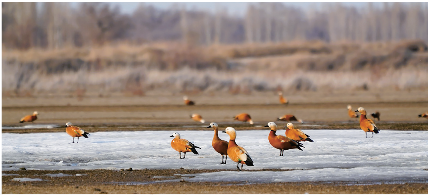
近日,吉木萨尔县红旗农场下兴湖水库,赤麻鸭成群结队。