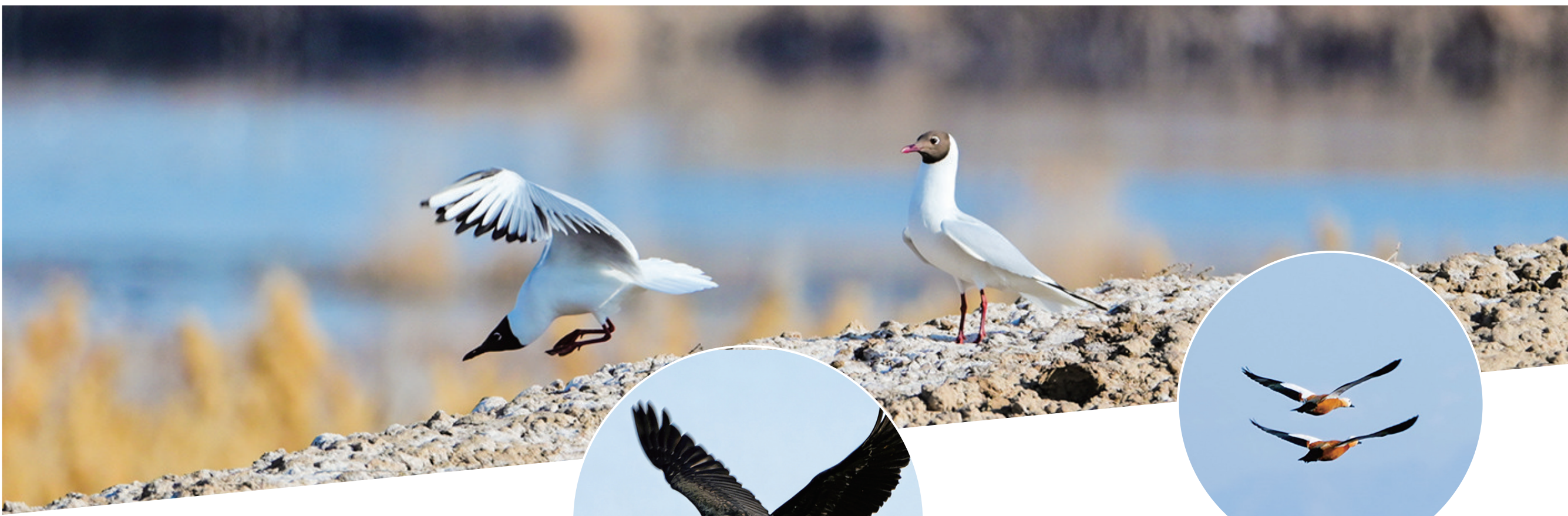
3月29日,候鸟给呼图壁县五工台镇百泉湖湿地增添了一份蓬勃的生机。