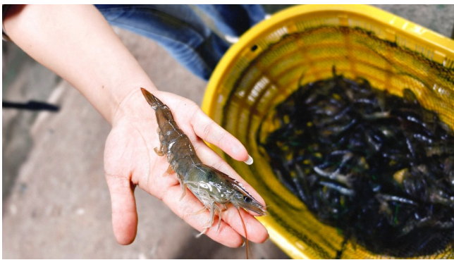
南美白对虾长度约15厘米,差不多有成年人手掌大小。