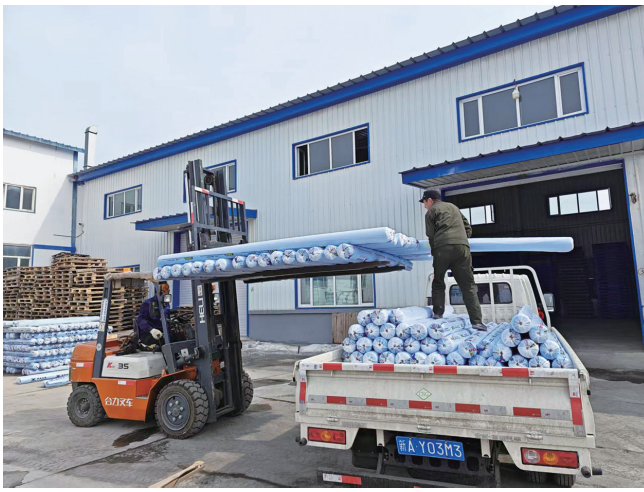
新疆金新城生物科技开发有限公司的仓库前，工人们正在装货。