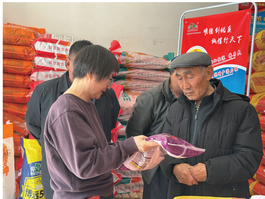
昌吉市科田种子经销部负责人正在给种植户介绍产品。