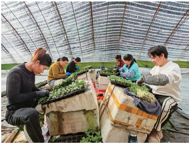
新疆豫盟瓜果种植合作社的育苗大棚内，工人们正忙着嫁接瓜苗。