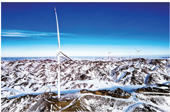
木垒县大石头风电规划区，风机在山上矗立。(1月7日摄)