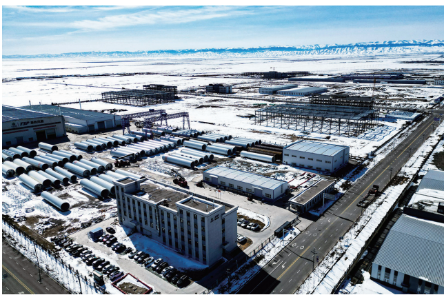
木垒县新能源装备制造基地内，昌吉州泰胜风能风电设备有限公司生产的风机塔筒在堆场整齐摆放。(3月17日摄)

新能源企业建设者们也在与时间赛跑。从首批项目集中开工算起，他们在295天内，克服高海拔、复杂地形、极端气候等重重困难，高质量完成了1299台风机、超过2900公里线路的建设任务，实现了规模翻倍、效率不降、质量更优。