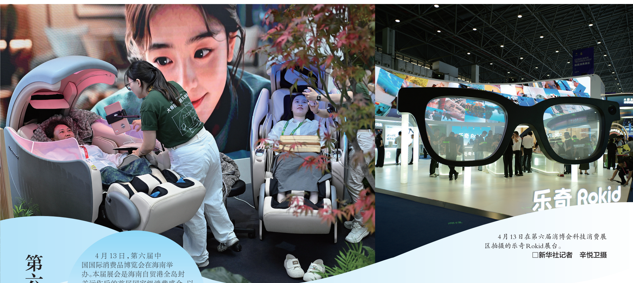
4月13日在第六届消博会科技消费展区拍摄的乐奇Rokid展台。