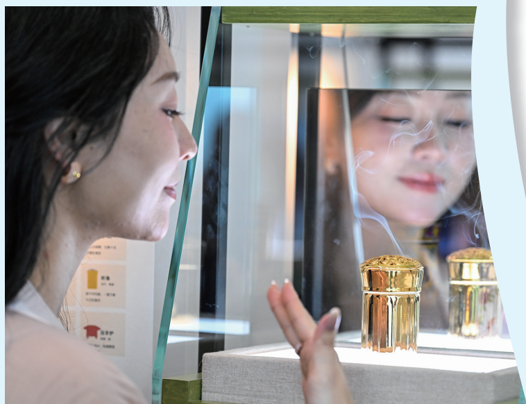
4月13日，参观者在第六届消博会主会场品鉴香产品。