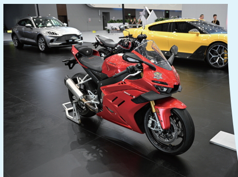
4月13日在第六届消博会主会场拍摄的一款张雪机车。