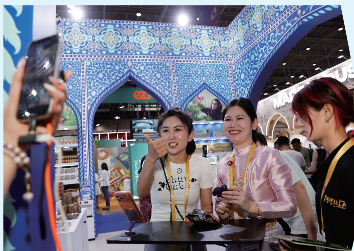
4月13日，主播在第六届消博会一处海外商品展台直播。