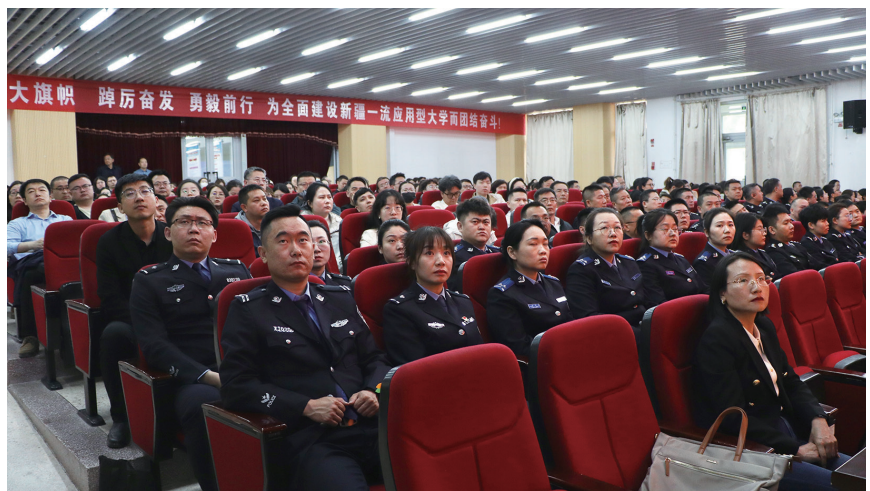
4月14日，昌吉州公安局公安干警代表、昌吉学院教职工聆听专题讲座。