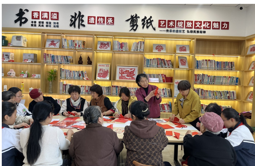
近日，居民们在社区打造的图书室开展非遗剪纸活动。

针对老年群体用餐难题，吉木萨尔县精准施策、贴心服务，增设社区助餐点，推出营养均衡、价格实惠的家常饭菜。同时，为高龄、独居老人提供上门送餐服务，用一餐热饭传递社区温情，切实解决老年群体“吃饭难”的问题。 吉木萨尔镇北地社区服务大厅的“便民服务驿站”内，修配工具、应急药箱、雨伞雨衣等一应俱全，居民凭有效证件登记即可免费借用。文明路社区则打造了“中医阁”，定期为行动不便的居民提供脉诊、养生咨询等服务。各社区还推出“帮办代办”服务，代为办理社保认证、医保缴费等高频事项。 此外，吉木萨尔县各社区积极盘活闲置空间，打造舞蹈室、乒乓球室等功能区域，持续优化“家门口的文化空间”功能，让居民在“小空间”中感受“大温暖”。