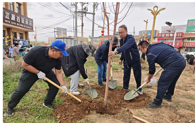
近日，吉木萨尔县三台镇干部群众在辖区主次干道沿线开展春季义务植树。

植树现场，干部群众三五成群，分工协作，配合默契。大家挥锹铲土、扶正树苗、培实新土、提水浇灌，每一道工序都认真细致。