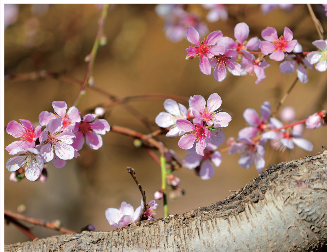
昌吉市三工镇桃园,桃花次第绽放,粉霞叠翠,春意盎然。

每一朵花都在诉说着春天的故事,每一片花瓣都承载着人们对美好生活的期盼。花开昌吉,醉了春风,也醉了人心。在这个繁花似锦的季节里,走在花下,日子也仿佛染上了花的颜色,明亮而温暖。