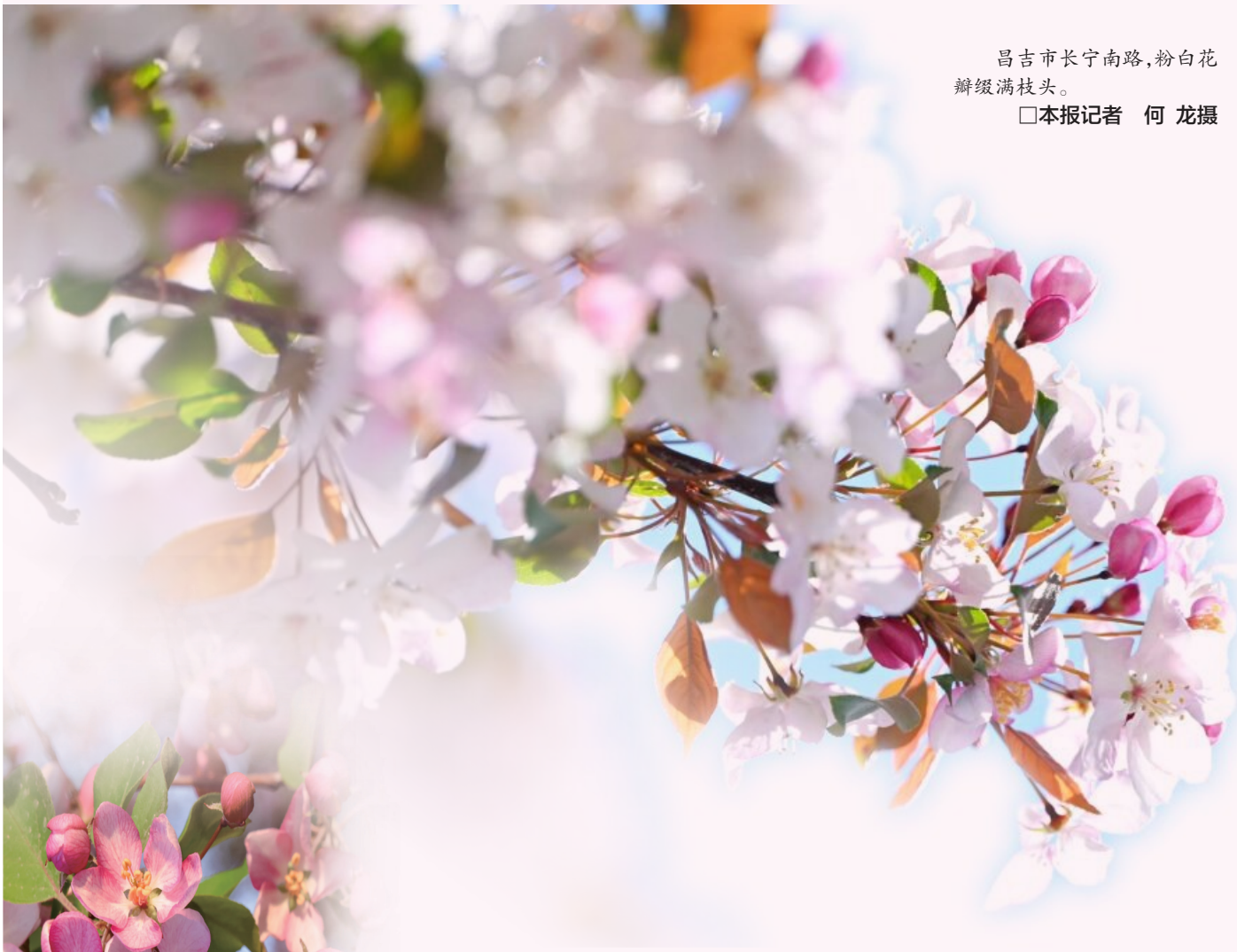
昌吉市长宁南路,粉白花瓣缀满枝头。 □本报记者 何龙摄