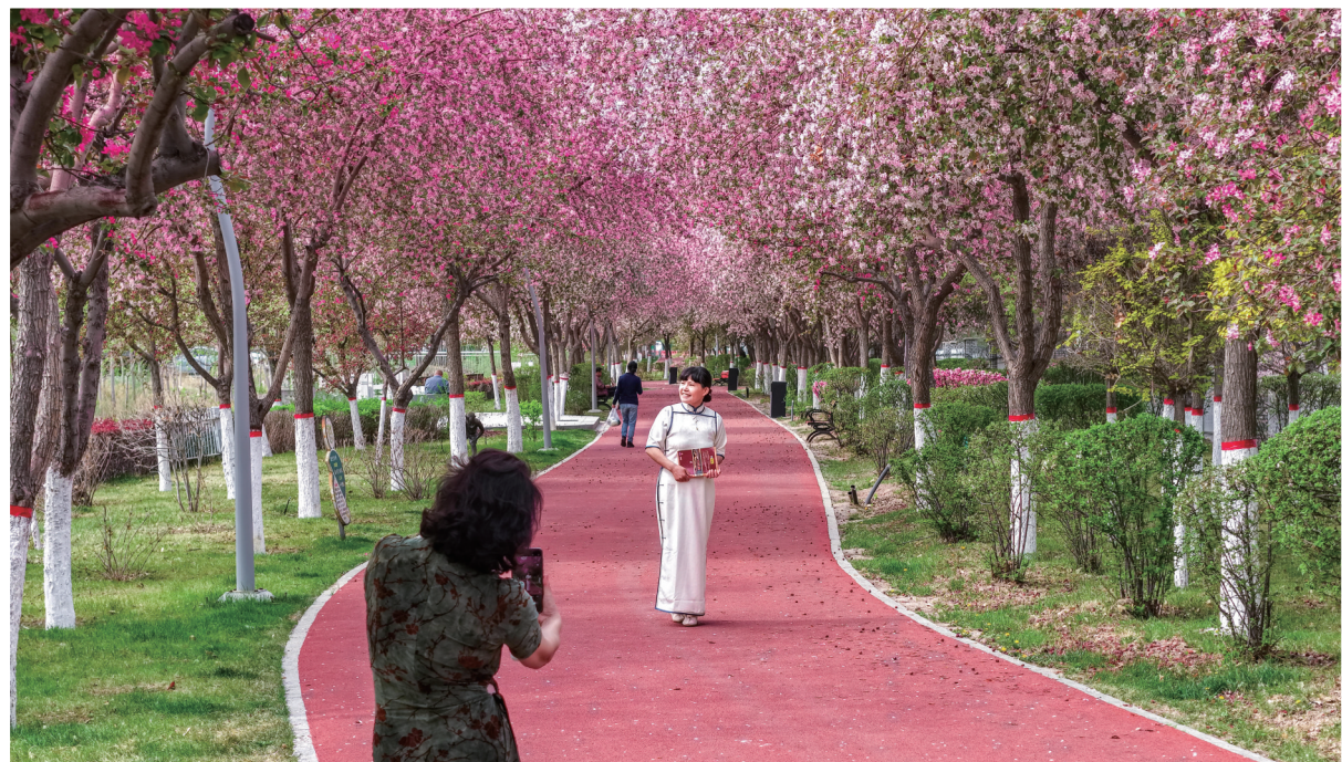
呼图壁县海棠路,游客在海棠花海中拍照打卡。