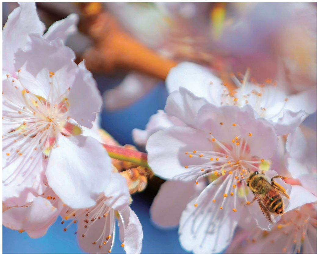
昌吉市三工镇桃园,蜜蜂在花丛中穿梭飞舞。