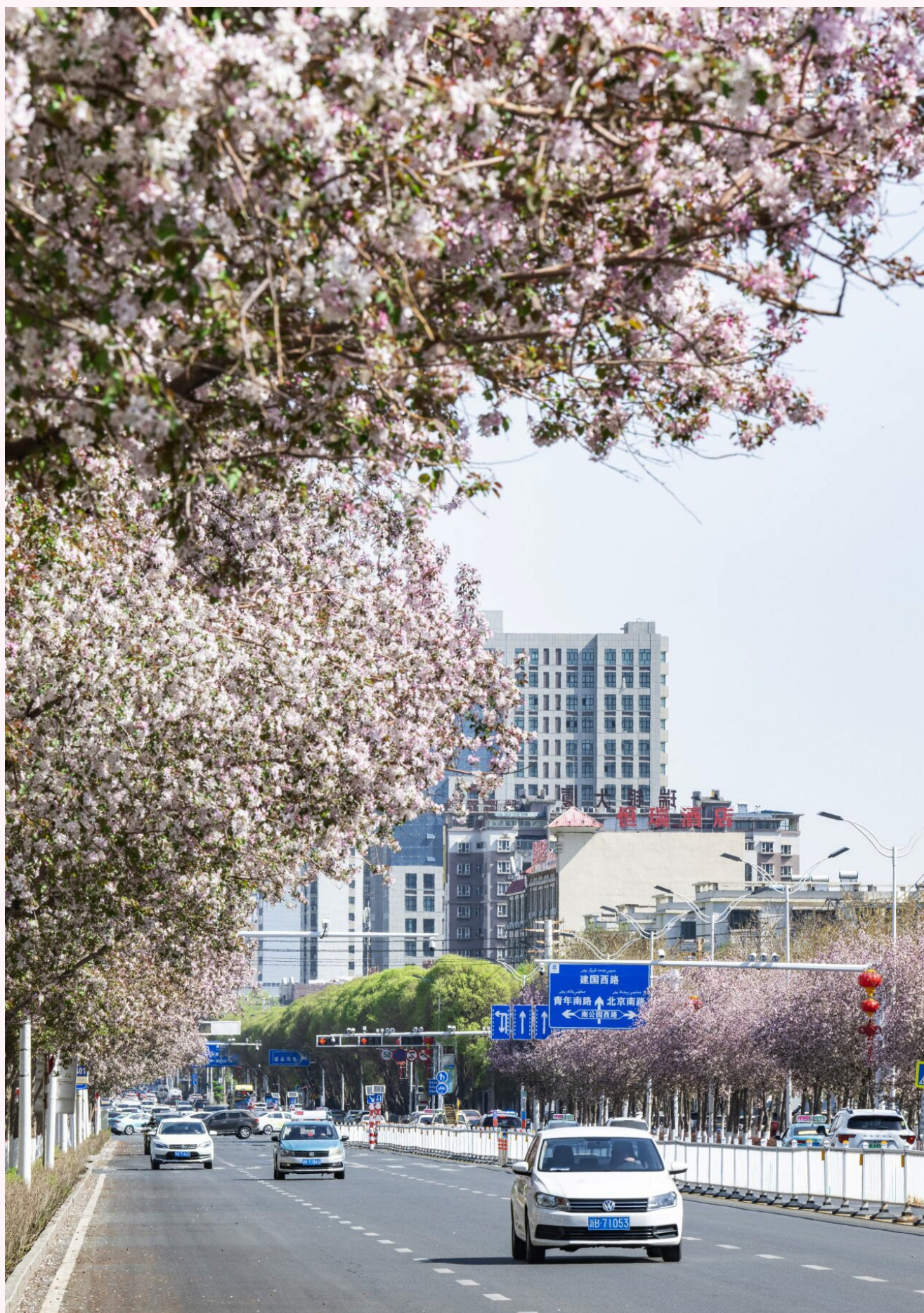
呼图壁县海棠路,粉白相间的海棠花热烈盛开。