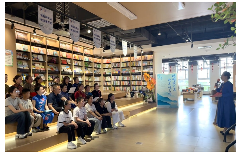
4月27日，“书香润昌吉·阅读暖花开”墨兰书社“一念花开读书群”读书分享与诗歌朗诵活动现场。