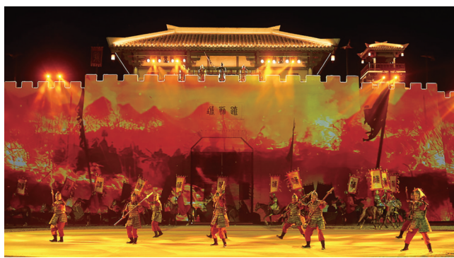
《月映疏勒城·策马向天山》大型沉浸式互动演艺。