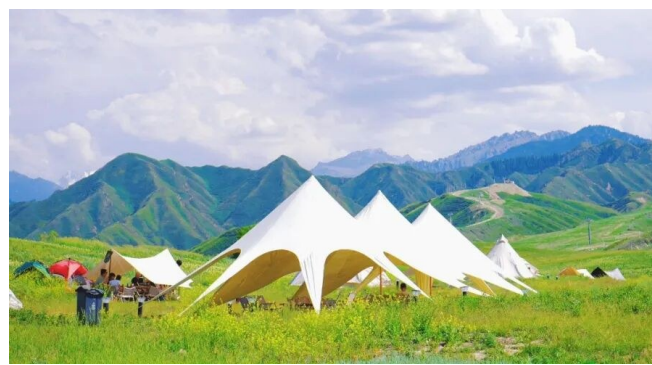
天山天池国际滑雪度假区牧野之家露营地。