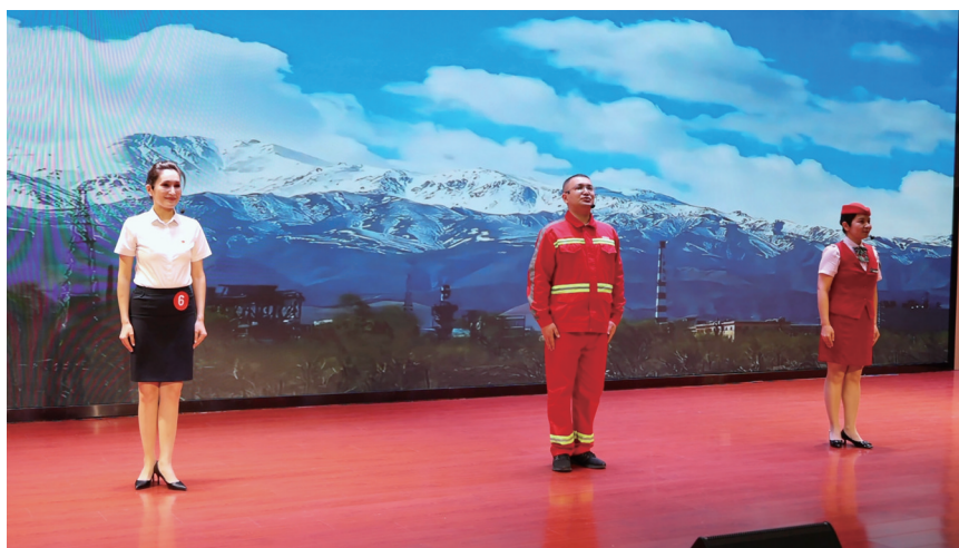
近日，第六届昌吉州企业职工国家通用语言演讲比赛决赛在吉木萨尔县工人文化宫举办。图为比赛现场。

“此次演讲比赛为全州各族企业职工搭建了学习交流、展示自我的优质平台，有效促进了各族职工交往交流交融。我们将持续开展各类职工文化活