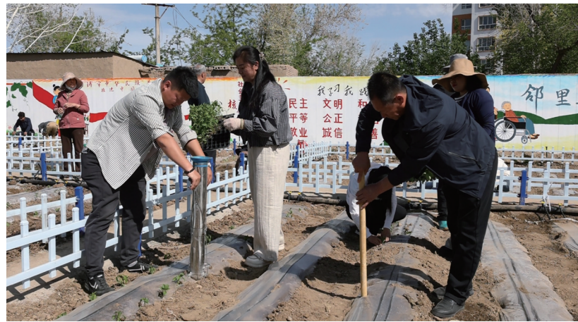
近日，在吉木萨尔县北地社区，居民们在社区打造的共享菜园里种植蔬菜。

本报讯 通讯员杨天文、李香莹报道：近日，吉木萨尔县吉木萨尔镇北地社区“近邻同心共享菜园”正式开园。