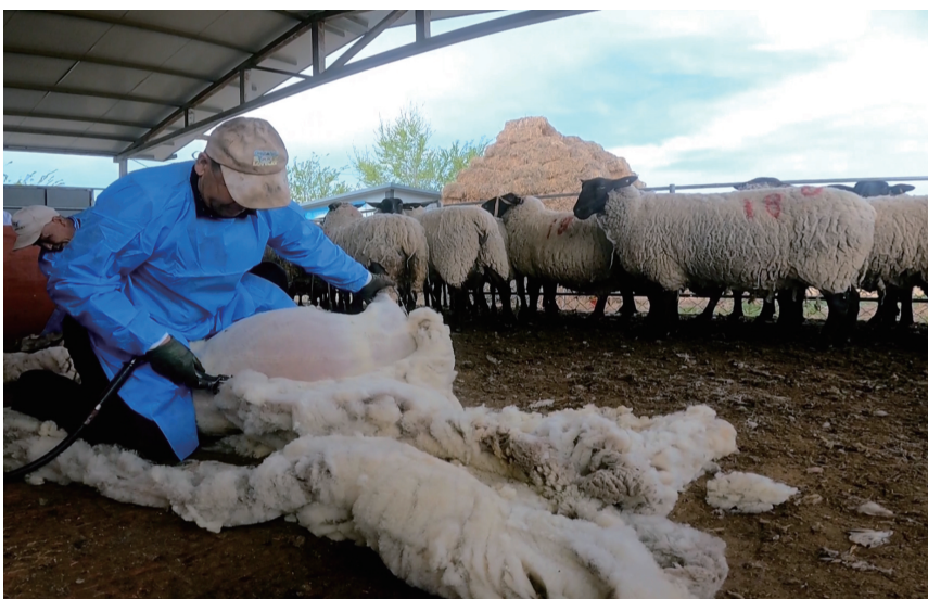
近日，在玛纳斯县萨福克羊核心育种基地，技术人员正在剪羊毛。

本报讯 通讯员瓦力斯江·乌马尔江、卡提合·阿不都克力木报道：随着气温逐渐回升，全县18万只羊陆续褪去厚重的“冬装”，以健康轻盈的状态迎接夏季的到来。