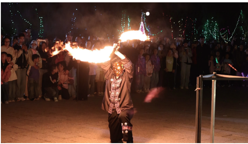
近日，在吉木萨尔县，游客们观看精彩的火焰杂技表演。

本报讯 通讯员杨天文、马凯雄报道：近日，吉木萨尔县举办梦幻灯光秀展演，以光影为媒、文化为魂，打造国潮夜游矩阵，点亮北地夜空，为游客献上一场沉浸式光影盛宴。