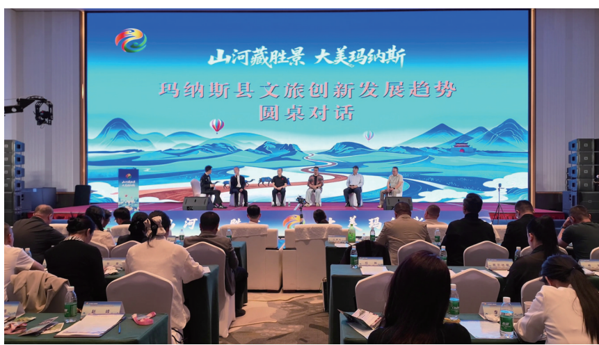
近日，在玛纳斯县文旅推介会上，与会嘉宾围绕该县文旅发展趋势进行交流探讨。

2025年，玛纳斯县成功获评2025全国县域自驾游标杆县，文旅产业发展势头强劲。今年，该县将加快构建全域旅游新格局，深挖特色资源、完善扶持政策，推动文旅资源优势转化为产业发展优势，为县域经济高质量发展注入新动能。