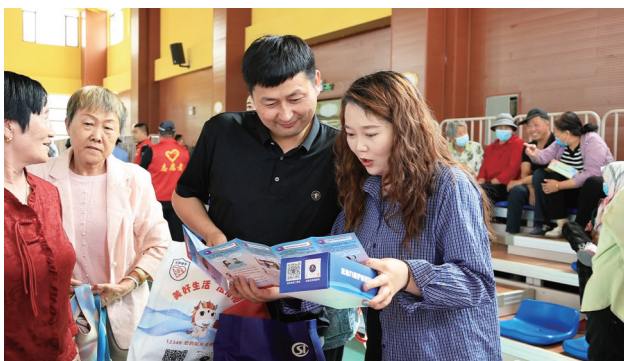
5月9日，吉木萨尔县二工镇董家湾村活动中心，工作人员向村民宣传惠民政策。