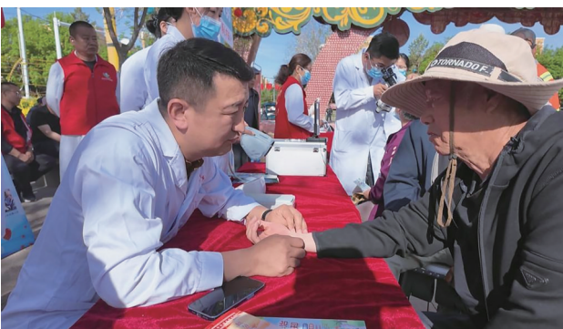
5月9日，木垒县木垒河广场，医生为居民把脉问诊。

范、身边好人、爱心企业踊跃捐款捐物，向困难家庭送去生活与学习物资；文艺志愿者登台献艺，以文艺节目传递公益理念、弘扬向善风尚。活动过后，健康义诊、政策宣讲、急救救护科普等多个服务专区有序开放，医护人员走进群众家门口，让他们就近享受贴心医疗服务。