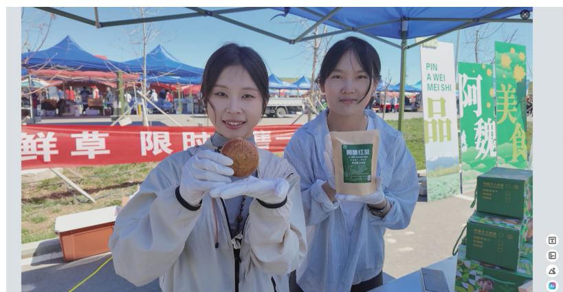
近日，玛纳斯县清水河乡举办“莆田援疆助力振兴 阿魏产业共发展”主题活动。图为工作人员展示阿魏手把馍、阿魏茶包。