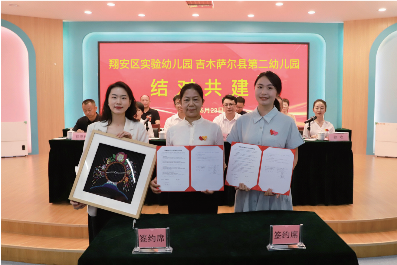
2025年6月23日，厦门市翔安区实验幼儿园与吉木萨尔县第二幼儿园签订结对共建协议。

吉木萨尔县打破过去“点对点”的专家派驻思维，依托厦门援疆力量构建起“横向到边、纵向到底”的人才孵化矩阵。一方面，依托厦门大学附属中山医院等后盾单位，建立新疆首个县级中西